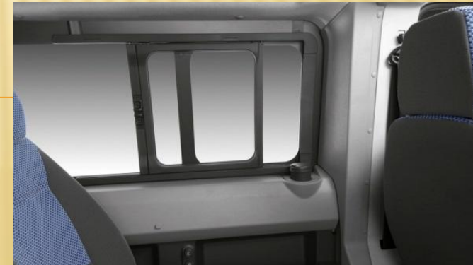
Type de baie conçue par l'entreprise